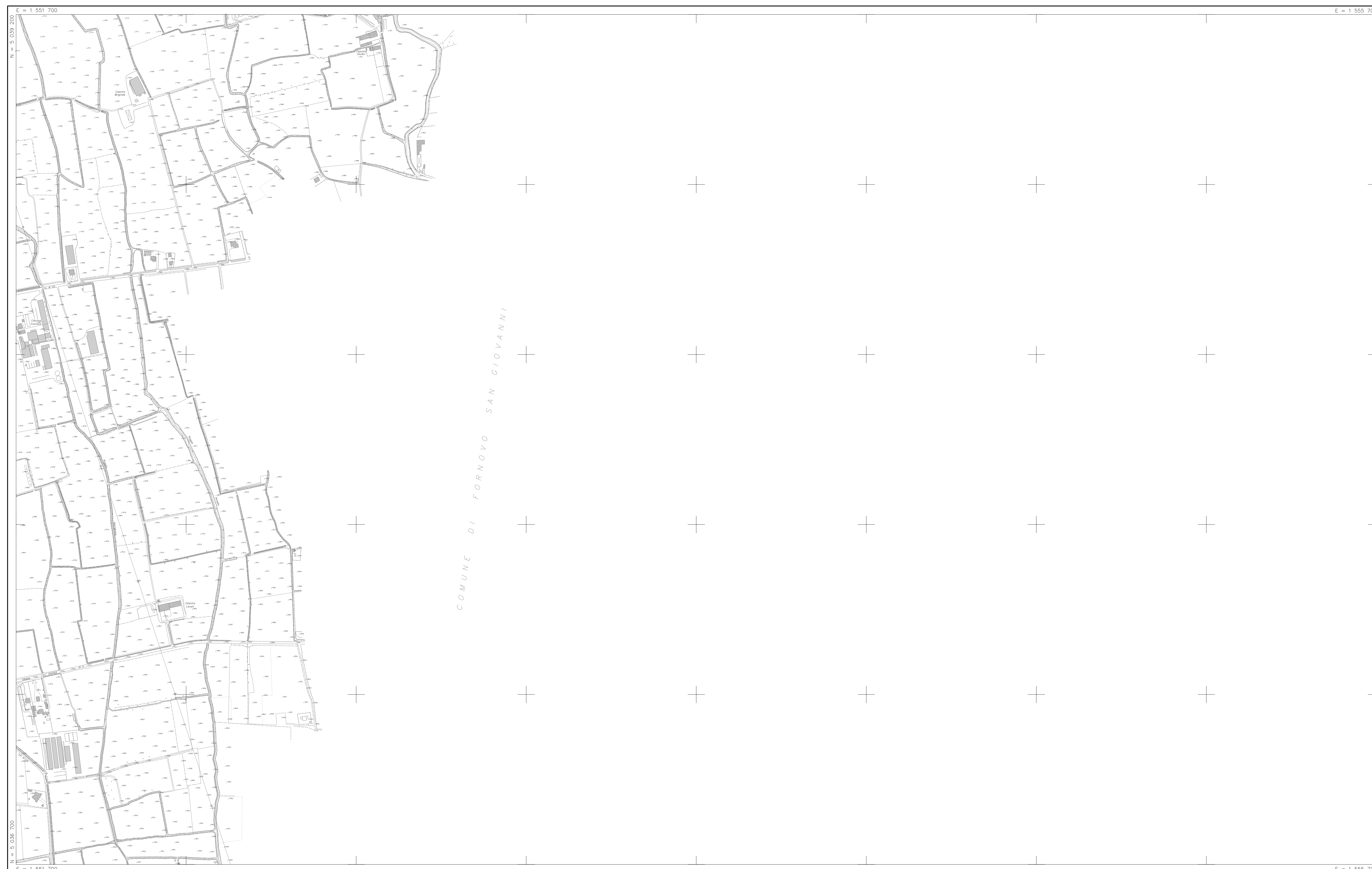
QUADRO D' UNIONE E INQUADRAMENTO C.T.R. 1:10.000

Cartografia numerica realizzata nell'anno 1996 Aggiornata con riprese aeree del 22 Febbraio 2019 Esecuzione: CANAVESE BERGAMO www.canavese.it - em@canavese.it