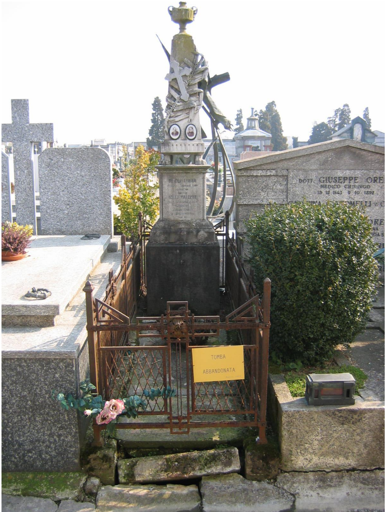
CAMPO E - N. 65 ESTERNO - INICO/NISOLI