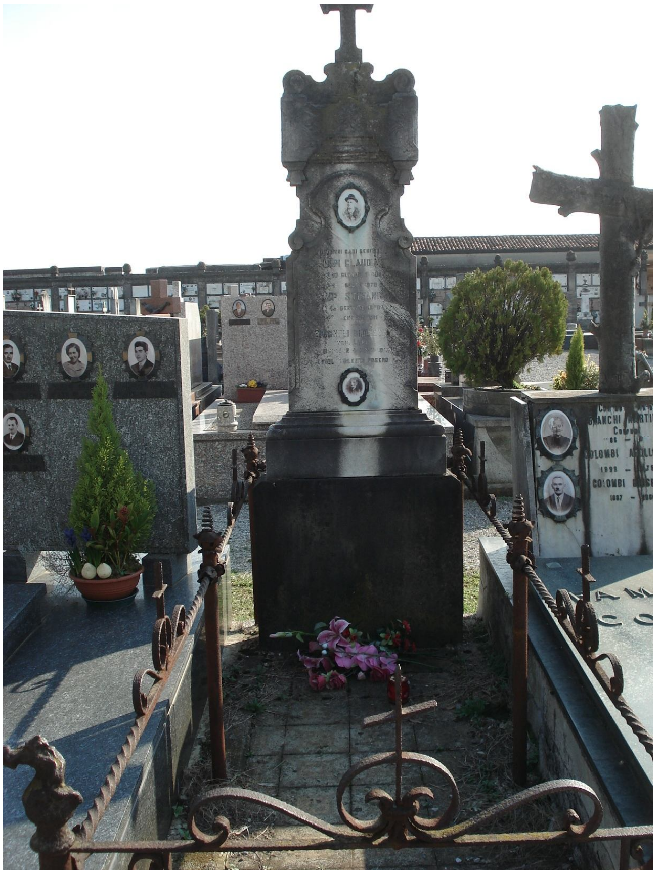
CAMPO B – N. 49 ESTERNO - LUPI