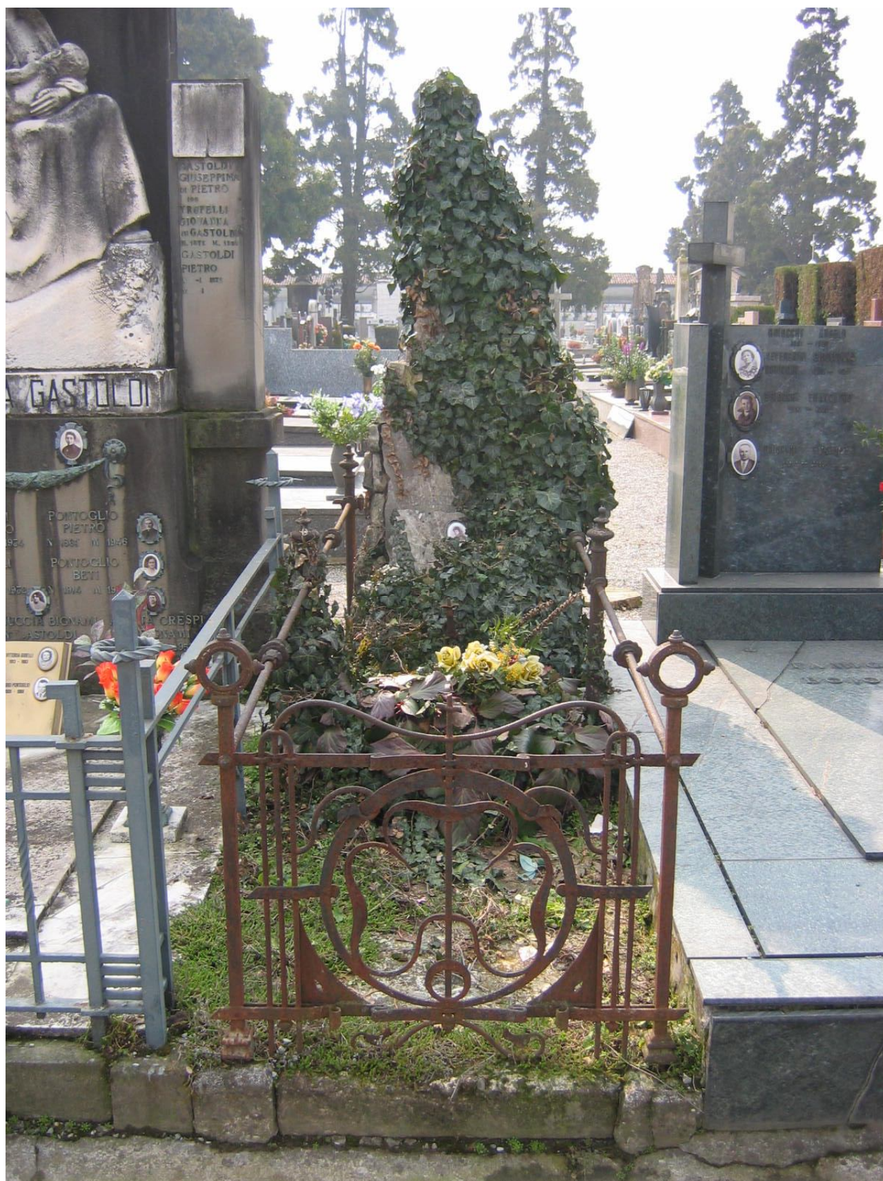
CAMPO D – N. 46 ESTERNO - MILONI