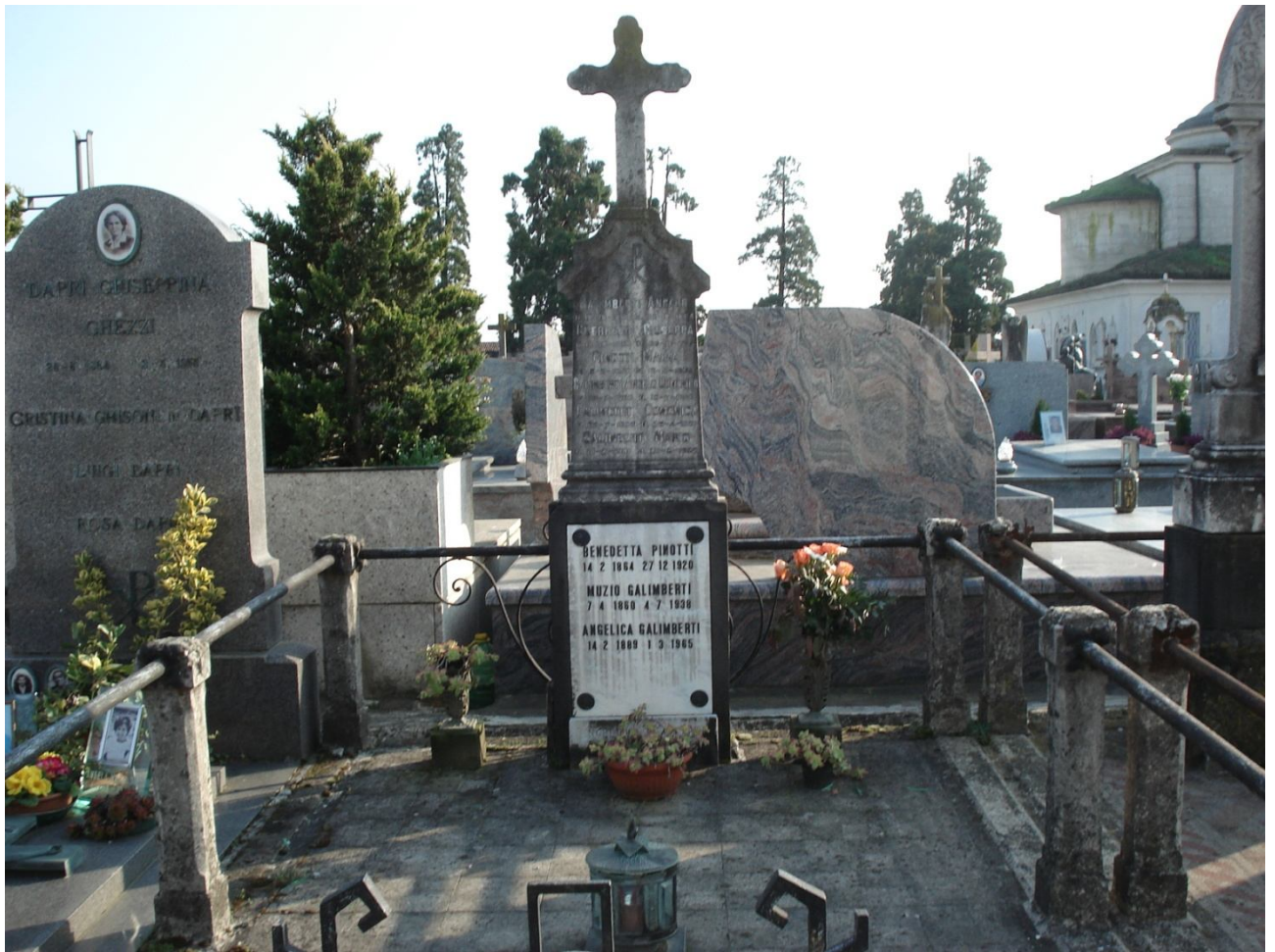
CAMPO E – N. 48 ESTERNO – DAPRI/GALIMBERTI