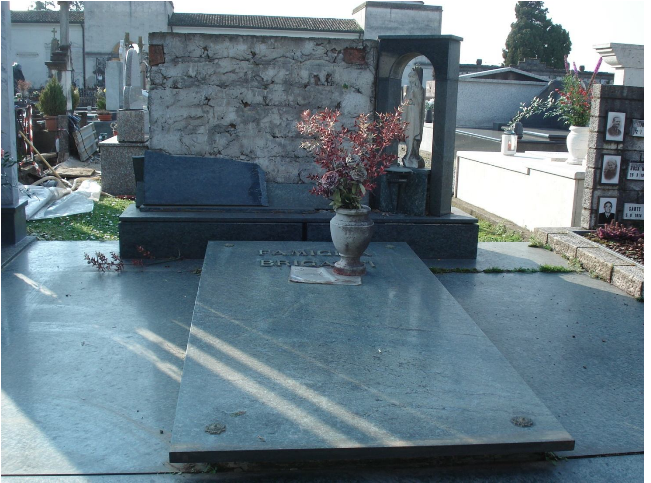
CAMPO E – N. 26 ESTERNO - BRIGATTI