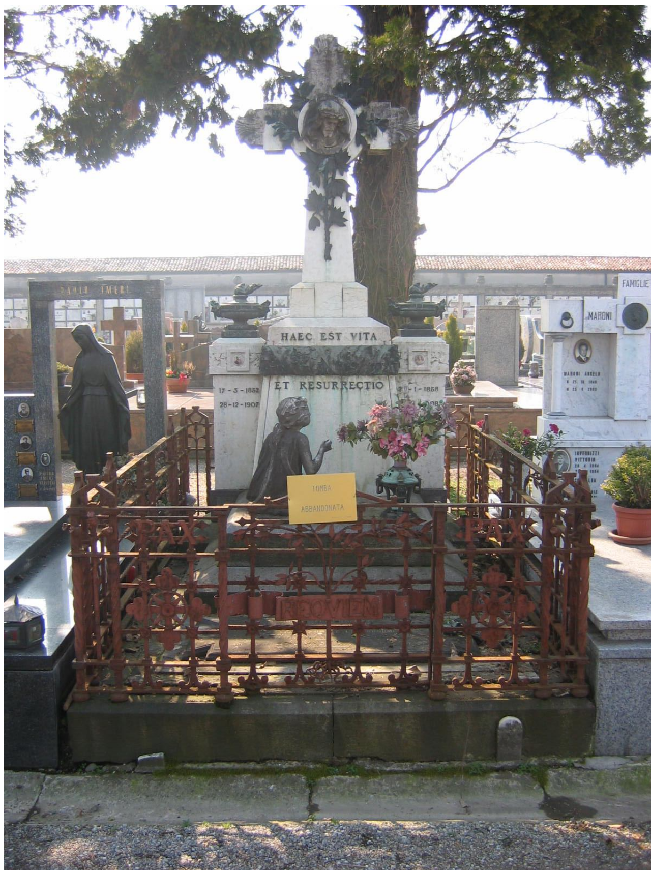
CAMPO A – N. 71 ESTERNO – BONOMI