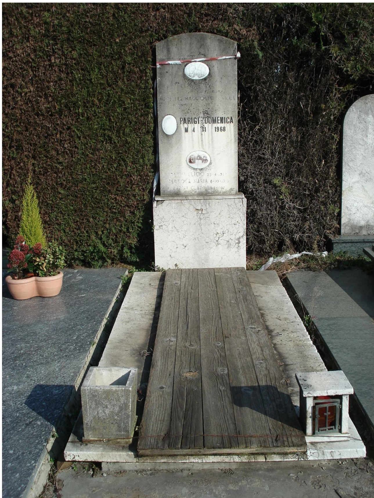
CAMPO B – N. 2 DOPPIA FILA ESTERNA - PARIGI