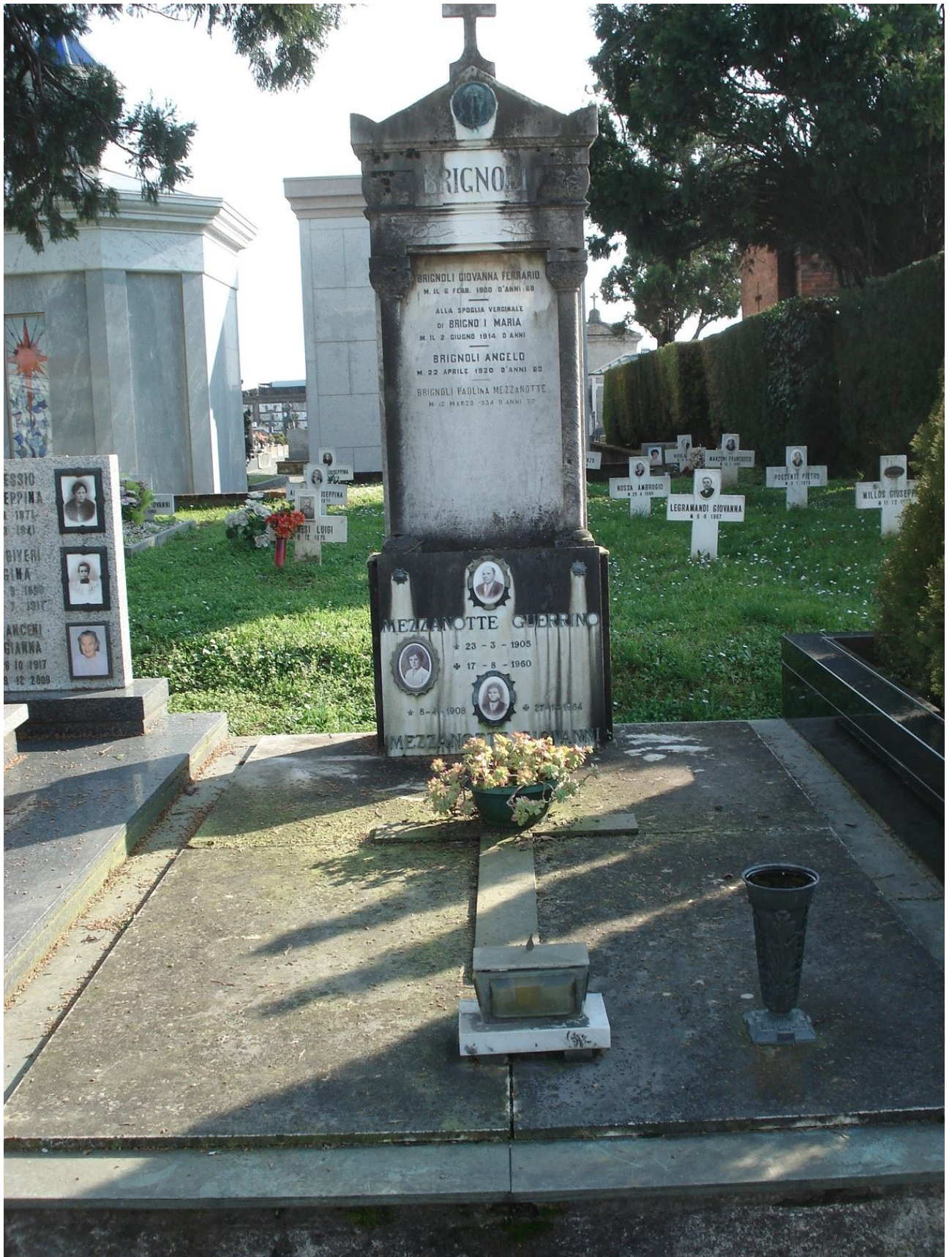
CAMPO C – N. 43 ESTERNO - MEZZANOTTE