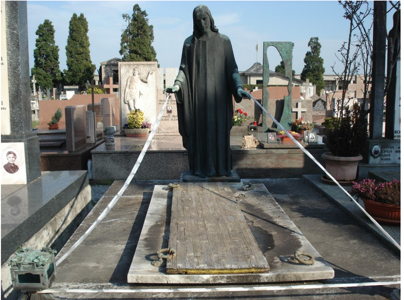
CAMPO B – N. 5 ESTERNO - MAINERI