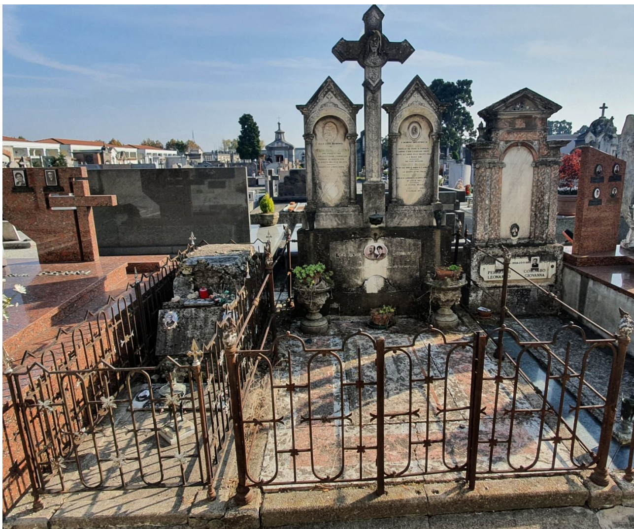
CAMPO E – N. 73-74 ESTERNO – PRINA/BEDOLINI