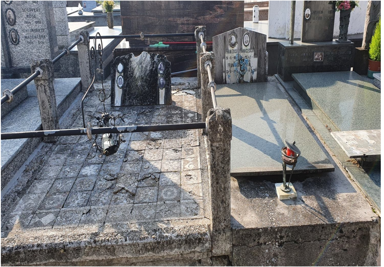
CAMPO E – N. 50 BIS -51 ESTERNO – INICO/FRANZOSI