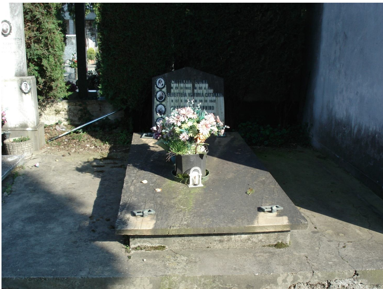
CAMPO C – N. 16 DOPPIA FILA ESTERNA - CATTADORI