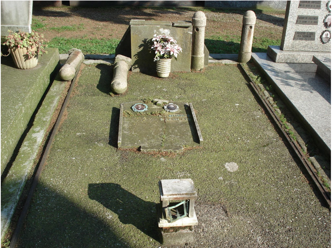
CAMPO A – N. 11 ESTERNO - MENECHINI