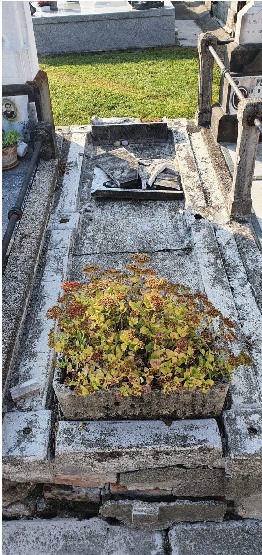
CAMPO E -N. 57 ESTERNO BARUFFI