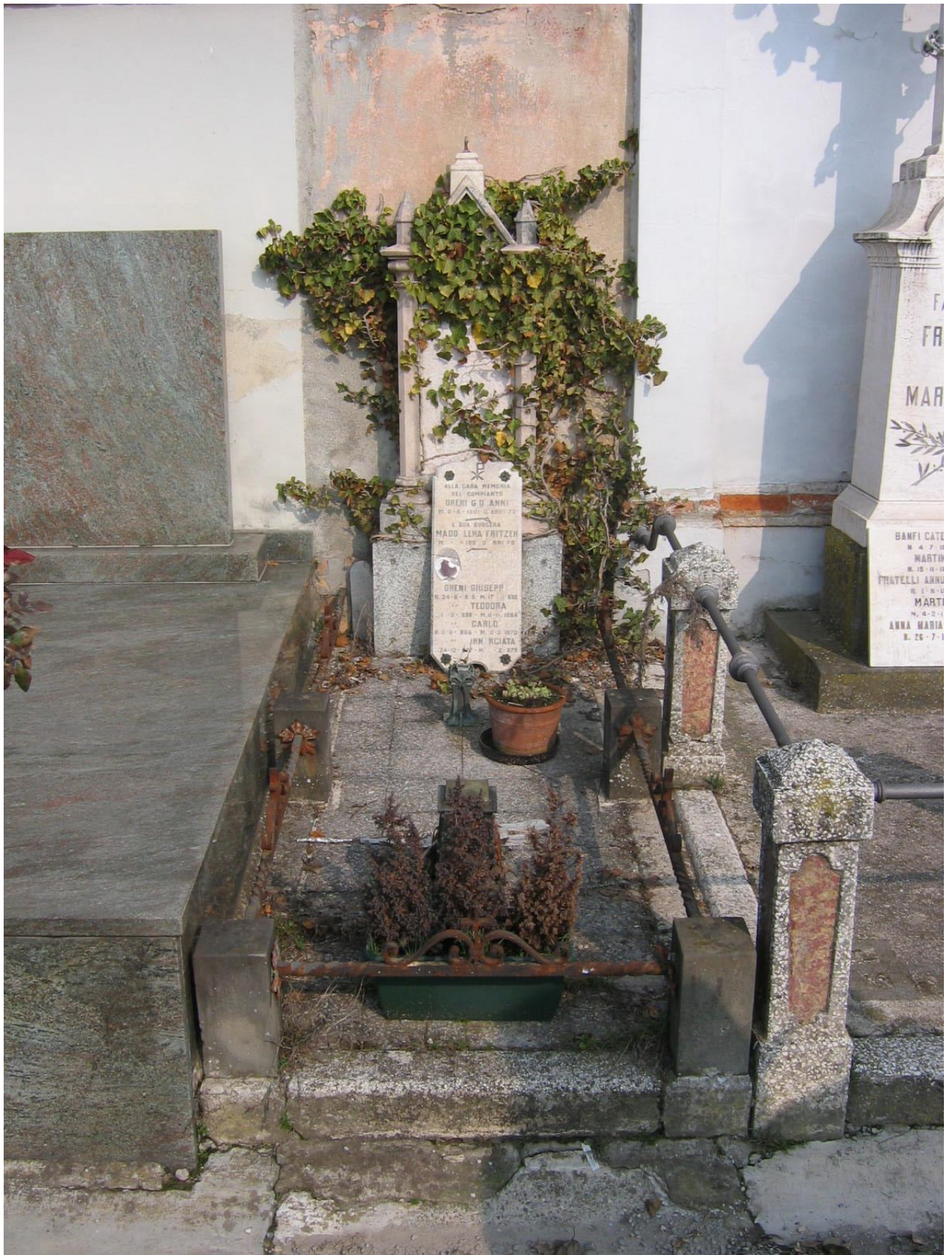
CAMPO F – N. 18 MURO DI CINTA - ORENI