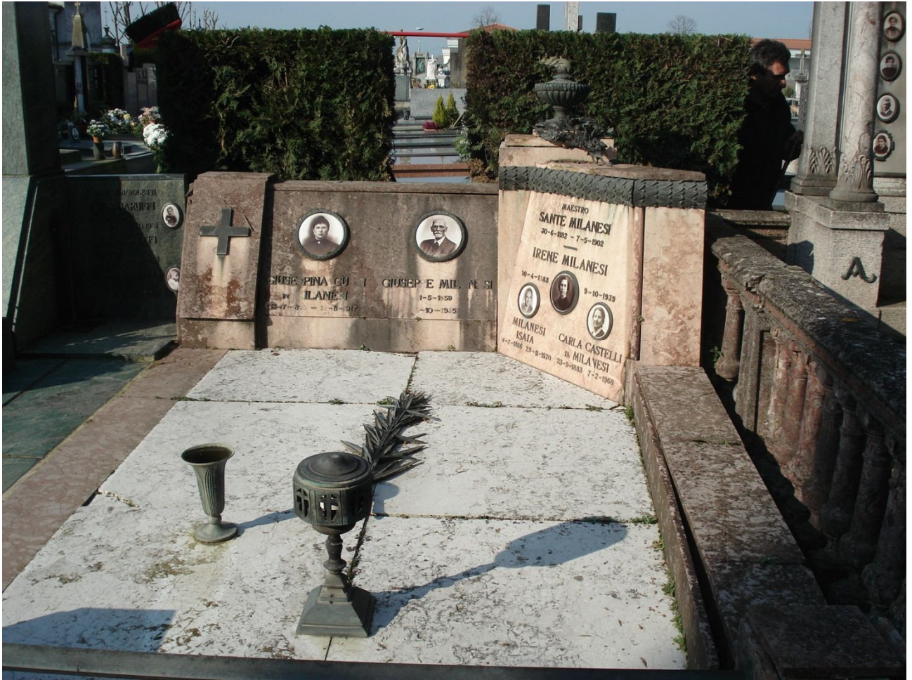
CAMPO D – N. 5 ESTERNO - MILANESI