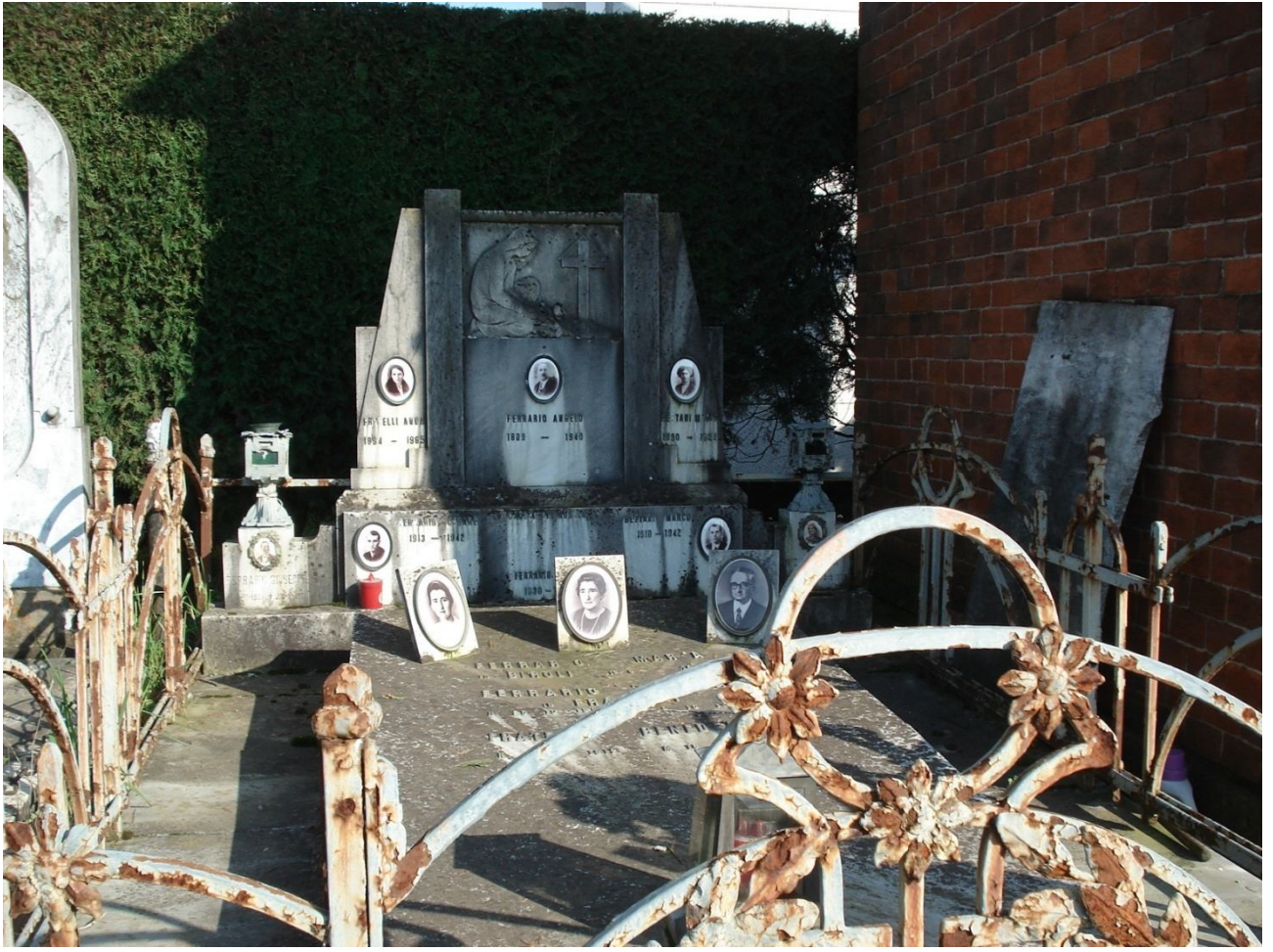
CAMPO C – N. 53 ESTERNO - FRATELLI