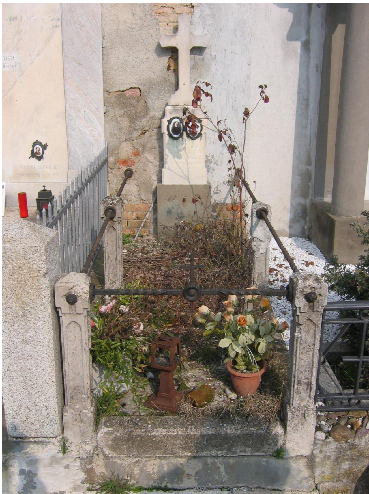
CAMPO F - N. 1 MURO DI CINTA - BOTTINELLI