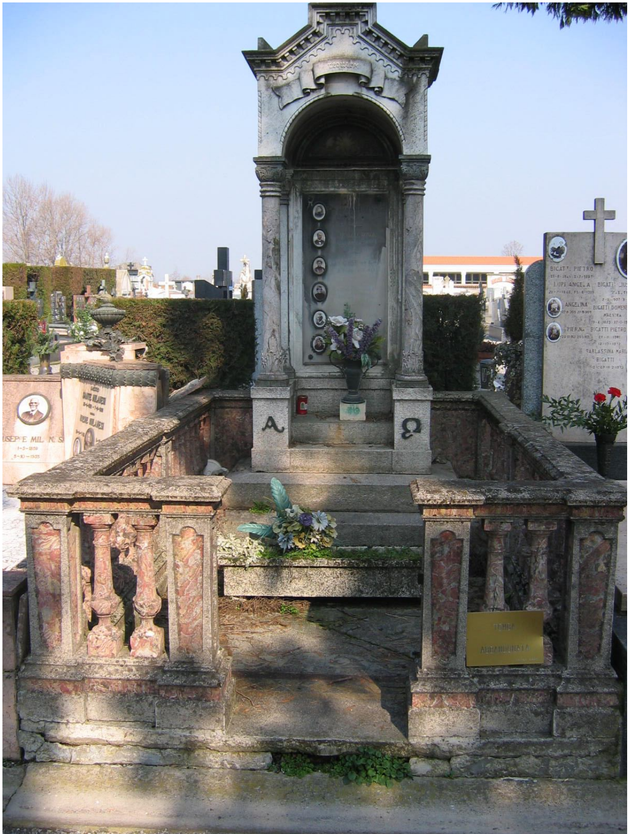
CAMPO D – N. 6 ESTERNO - BONOMI