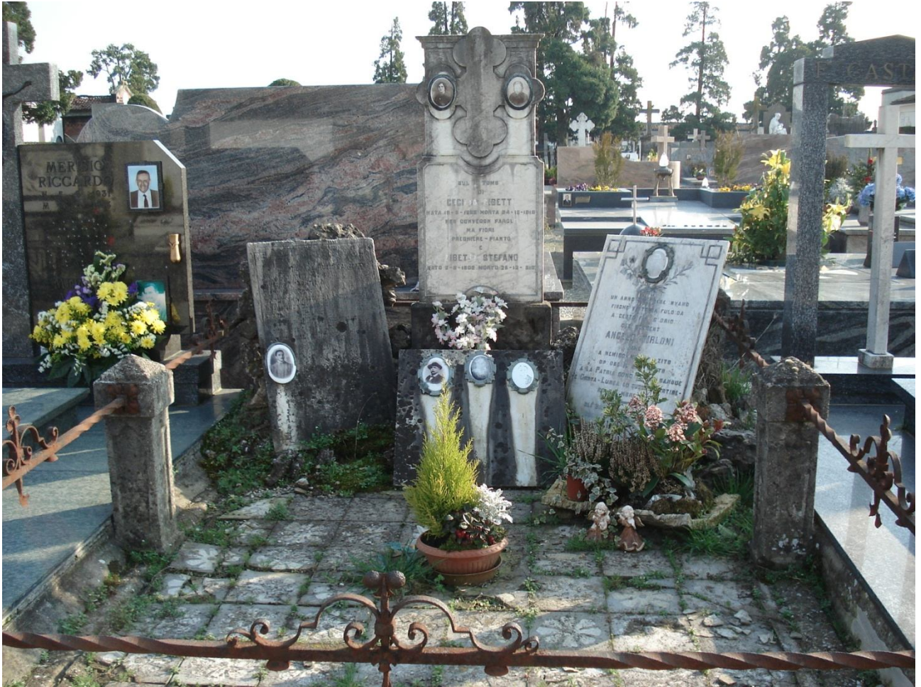
CAMPO E – N. 44 ESTERNO - ZIBETTI