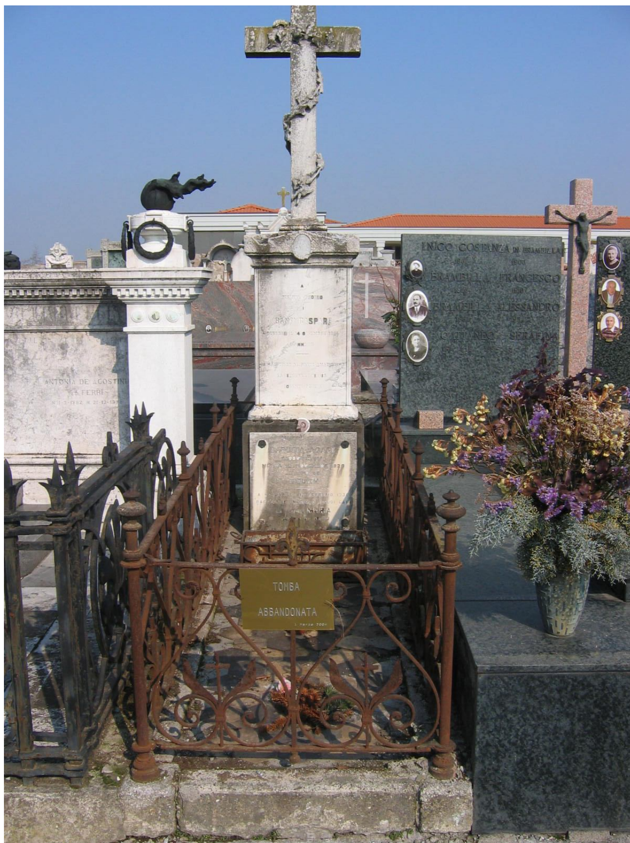
CAMPO E – N. 13 ESTERNO BANFI