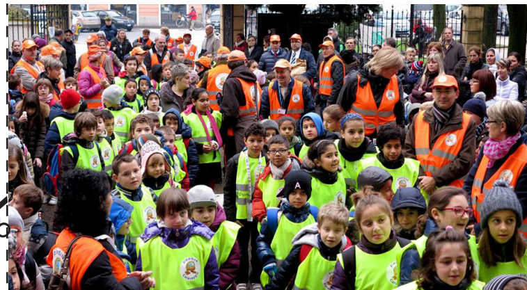
Stampato su carta riciclata